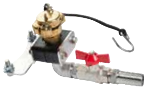
Aansluiting externe pomp