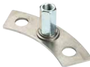
montagebeugel met afstandshuls

Geschikt voor alle gangbare tractor typen en leverbaar tegen een optimale prijs-kwaliteitverhouding!